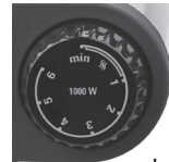
Left control knob