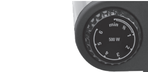
Control de temperatura del lado derecho