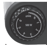
Right control knob